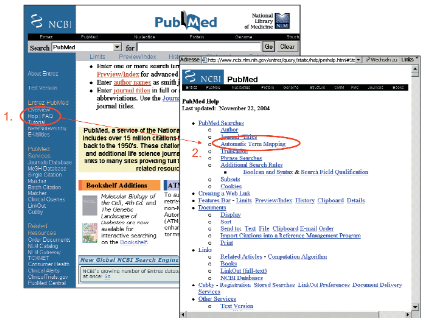
Abbildung 2 Help-Link auf der PubMed-Startseite