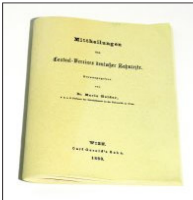
Abbildung 1 „Mittheilungen des Central-Vereins deutscher Zahnärzte“ (1860).