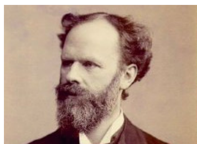
Abbildung 3 Willoughby Dayton Miller (1853–1907) – Begründer der chemisch-parasitären Karies-Theorie und berühmtester Präsident der Gesellschaft.

Doch trotz vereinter Bemühungen gelang es CVdZ und VbDZ erst im Jahr 1909, die Einführung des Abiturs als verbindliche Studienvoraussetzung für das Fach Zahnheilkunde durchzusetzen. Nun war die seit fünf Jahrzehnten angestrebte Angleichung an den bildungsbürgerlichen Beruf des Arztes erreicht. Im Jahr 1919 wurde den deutschen Zahnärzten zudem das Promotionsrecht im eigenen Fach und 1923 überdies die