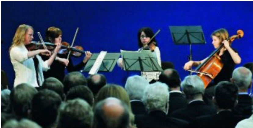
Ein Streichquartett untermalte den Festakt.

Als älteste zahnärztliche Vereinigung habe die DGZMK ihre Gründungs-idee etabliert, lobte der Parlamentarische Staatssekretär im Bundesgesundheitsministerium, Rolf Schwantz (SPD). Er erwarte, dass in Zukunft die zahnärztliche Versorgungsforschung, die an vielen Stellen noch ein Schattendasein führe, ebenso wie die evidenzbasierte Zahn-, Mund- und Kieferheilkunde an Bedeutung gewinne. Es sei eine stärkere Ausrichtung auf die Versorgung älterer Menschen erforderlich. „Ich bin sicher, dass die DGZMK diese Herausforderungen meistern und weiter die zukunfts-fähige Zahnmedizin mitgestalten wird“, erklärte Schwantz .