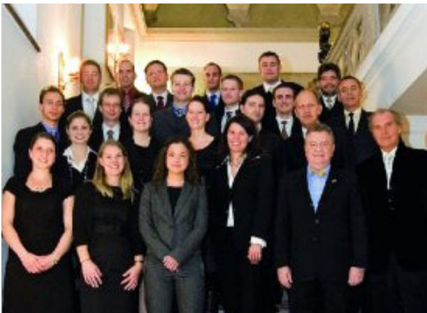
Abbildung 1 Die 20 erfolgreichen und glücklichen Gewinner des diesjährigen Dentsply-Förderpreises und die Jury.

Festliche Vergabe des 23. BZÄK/DGZMK/Dentsply-Förderpreises / DGZMK-Präsident Hoffmann lobt Engagement für Nachwuchswissenschaftler