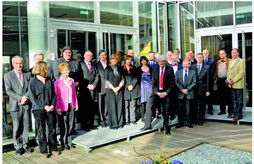
Die Gründungsmitglieder des AK Ethik während der Gründungsitzung in Frankfurt.

In allen Bereichen zahnärztlicher Forschung, Lehre und Therapie nehmen ethische Fragen einen breiten Raum ein. Ihre Diskussion muss daher interdisziplinär erfolgen. Der niedergelassene Zahnarzt arbeitet im Spannungsfeld zwischen hohem fachlichem Anspruch und einer Versorgungsrealität, die durch Begriffe wie Budget, Rationierung und Sachleistung geprägt ist. Mehr denn je ist er dabei gehalten, die Patientenautonomie zu berücksichtigen. Mit den sich daraus ergebenden ethischen Fragestellungen bleibt er alleine gelassen. Ähnlich ergeht es dem Hochschullehrer, der zunehmend mit der Beschaffung von Finanzmitteln befasst ist, gleichzeitig aber mehr Studenten als je zuvor ausbilden soll, ohne die Forschung zu vernachlässigen.