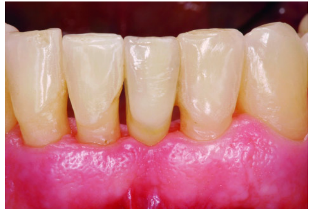
Abbildung 3 Adhäsivbrücke Regio 31, drei Jahre in situ.