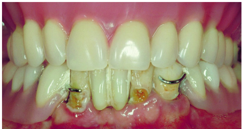
Abbildung 1 Nebenwirkungen einer klammerverankerten Teilprothese aufgrund verstärkter Plaqueanlagerungen.

Bei abnehmbarem Zahnersatz fallen insbesondere die Nebenwirkungen der klammerverankerten Prothesen durch verstärkte Plaqueanlagerungen an den Zähnen und Prothesen, Kariesprogression (insbesondere Wurzelkaries), zunehmende parodontale Erkrankungen und das verstärkte Auftreten von Prothesenstomatopathien auf [21] (Abb. 1). Auffällig ist diesbezüglich vor allem bei älteren Menschen die Diskrepanz zwischen einem häufig mangelhaften objektiven Befund und dem subjektiven Befinden des Patienten [31]. Ältere Menschen weisen ein so genanntes altersspezifisches „Underreporting“ auf, d. h.,