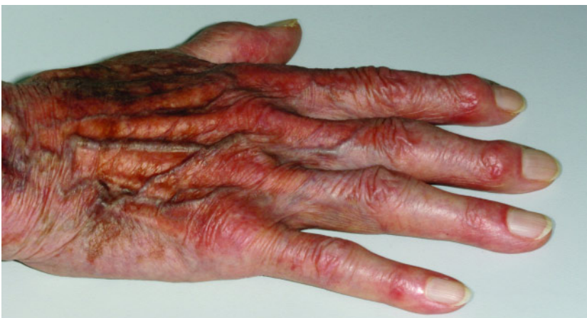
Abbildung 3 Hand einer 92-jährigen Patientin mit eingeschränkten manuellen Fähigkeiten.

Ein weiterer Risikofaktor stellt das Alter der Patienten dar. Bedenkt man, dass das durchschnittliche Alter der Patienten, die herausnehmbaren Zahnersatz tragen, höher ist, dann ergibt sich das Problem, dass mit zunehmendem Alter der Abstand zwischen den Kontrolluntersuchungen allenfalls noch 12 Monate beträgt. Dieses Verhalten wird wesentlich gefördert durch das vom Gesetzgeber etablierte Bonussystem für Zahnersatzleistungen und die damit in Zusammenhang stehende einmal jährliche Befreiung von der Praxisgebühr bei einer Vorsorgeuntersuchung [12]. Es ist auch offensichtlich, dass bei den Betroffenen ein Informationsdefizit besteht, da sie oft nicht wissen, dass engmaschig terminierte Nachsorgeuntersuchungen zur Gesunderhaltung des Kauorgans beitragen.