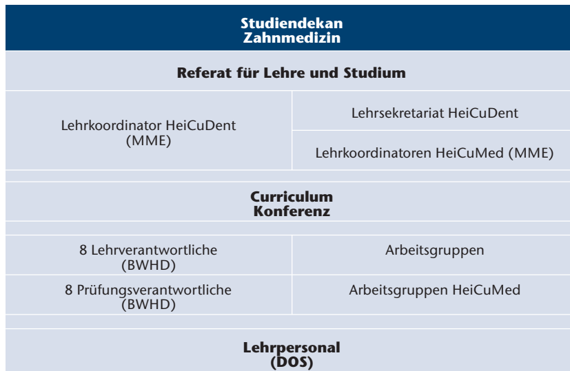
Abbildung 1 Organigramm zur organisatorischen Struktur von HeiCuDent und didaktische Qualifikation (MME: Master of Medical Education, BWHD: Baden-Württemberg Zertifikat Hochschuldidaktik, DOS: Dozentenschulung der Medizinischen Fakultät Heidelberg).