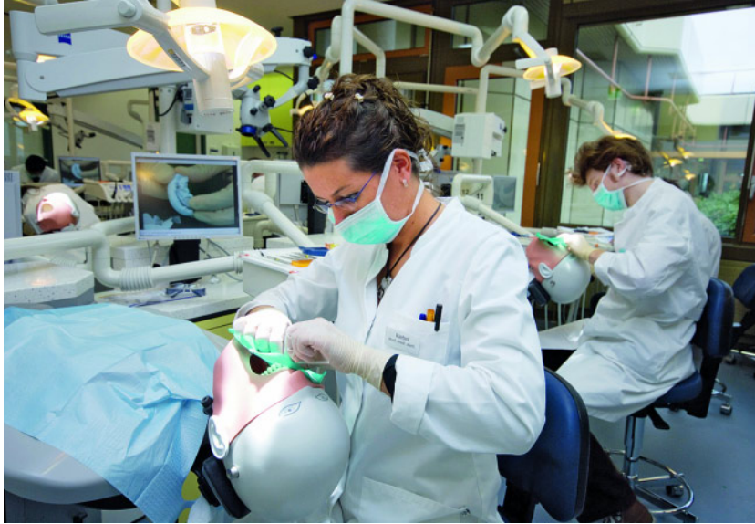
Abbildung 7 Skills-Lab Vorklinik.