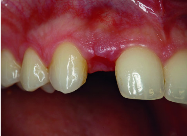
Abbildung 2 Lücke regio 12 wird mit einer Adhäsivbrücke geschlossen.