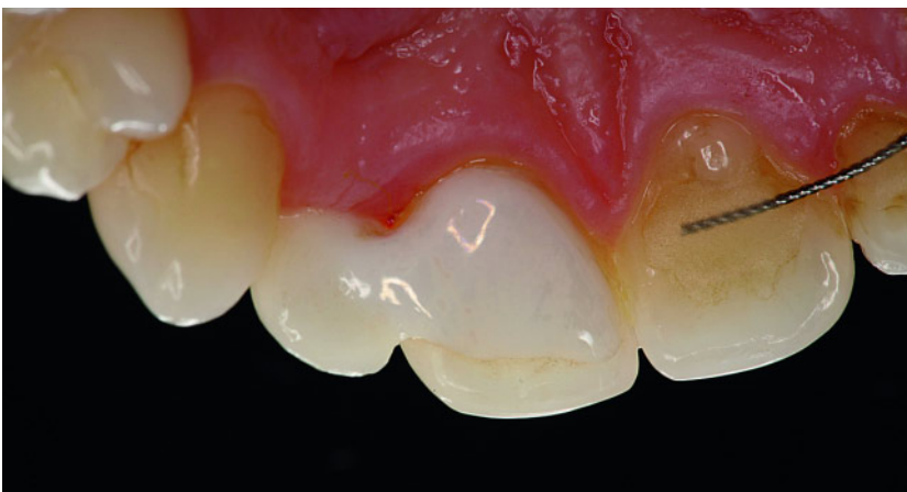
Abbildung 6 Endgültige Versorgung von palatinal.