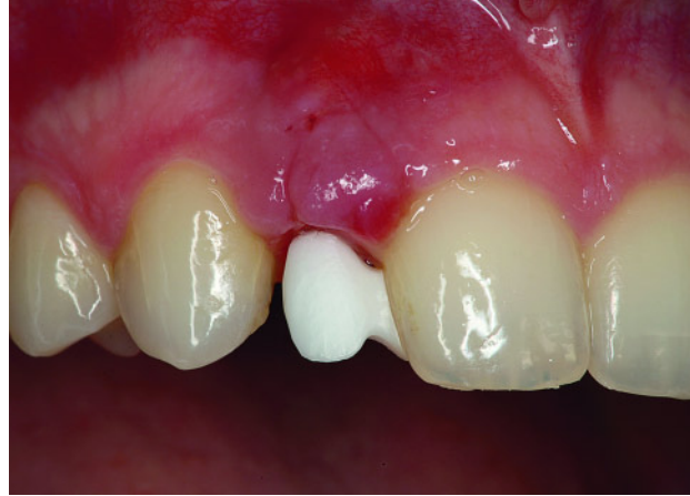
Abbildung 3 Einflügeliges ZrO_2 -Gerüst bei der Anprobe.