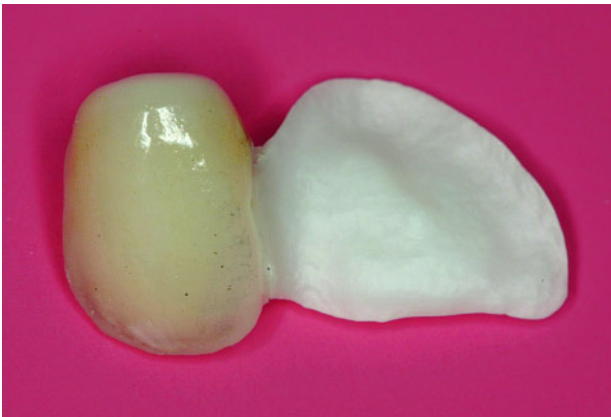
Abbildung 4 ZrO_2 -Flügel mit verblendetem Zahn 12 zur palatinalen Befestigung an Zahn 11.