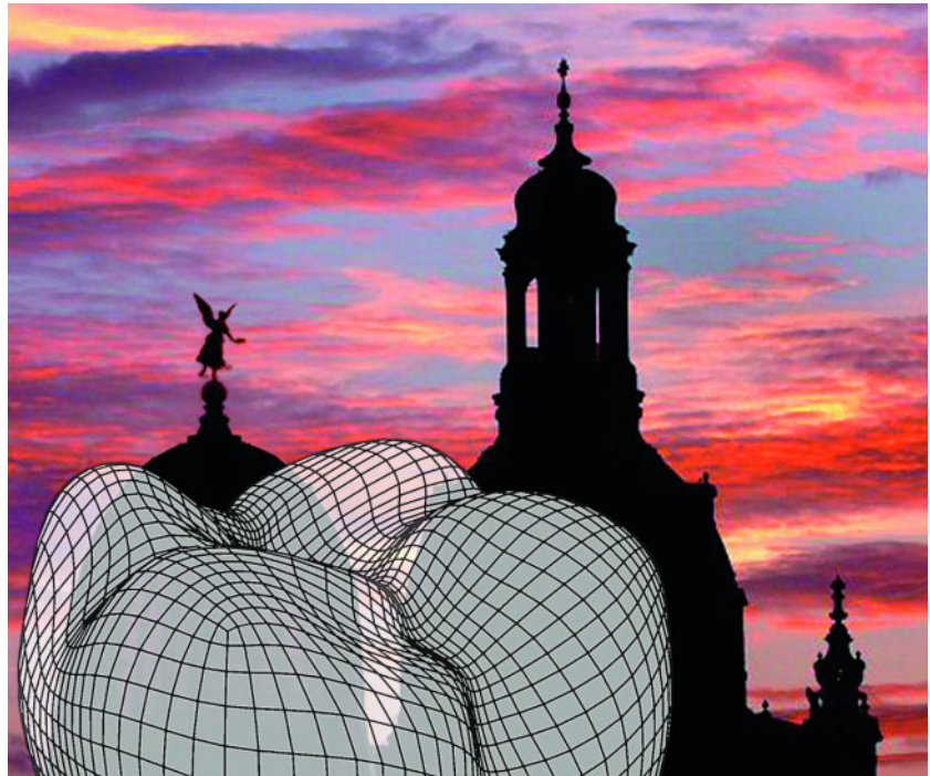
Abbildung 1 11 Jahre klinische Erfahrung bietet das 11. Keramik -Symposium der AG Keramik in Dresden.