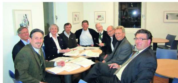
Abbildung 2 Task Force Algorithmus mit Zahnmedizinern und Schlafmedizinern, Mathematikum Gießen.