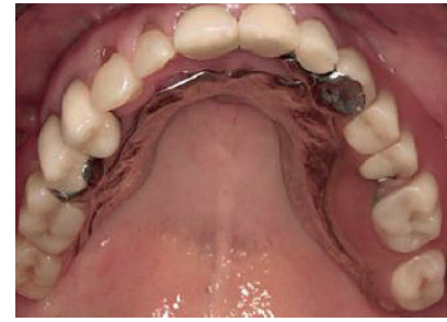
Abbildung 4a Intraorale, okklusale Ansicht der insuffizienten Oberkieferversorgung.

Die zahnärztliche Untersuchung bei Gorlin-Goltz-Patienten spielt eine enorm wichtige Rolle, da die Erkrankung auf-