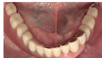
Abbildung 4b Intraorale, okklusale Ansicht der insuffizienten Unterkieferversorgung.

Figure 4a Intraoral, occlusal view of the insufficient supply of the maxilla.