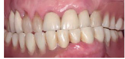
Abbildung 3 Intraorale vestibuläre Ansicht der Ausgangssituation. Figure 3 Intraoral vestibular view of the initial situation.

wurden neben den Basalzellkarzinomen ebenso dermatologisch therapiert.