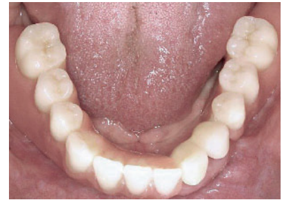
Abbildung 7b Intraorale, okklusale Ansicht des mit Teleskopkronen versorgten Unterkiefers.

Figure 8a Intraoral, occlusal view of the new maxilla supply.