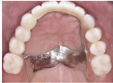
Abbildung 7a Intraorale, okklusale Ansicht des mit Teleskopkronen versorgten Oberkiefers.

Die Therapie der Erkrankung im Mund-, Kiefer- und Gesichtsbereich erfolgt symptomatisch, indem auftretende pathologische Veränderungen wie Basal-