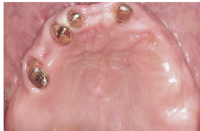
Abbildung 8a Intraorale, okklusale Ansicht der neuen Oberkieferversorgung.

Figure 7a Intraoral, occlusal view of the maxilla supplied with telescopic crowns/prostheses.