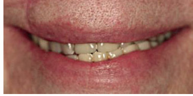
Abbildung 2 Lippenbild der Ausgangssituation. Figure 2 Lip image of the initial situation.