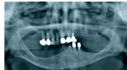
Abbildung 5 OPT der Ausgangssituation.

Figure 4b Intraoral, occlusal view of the insufficient supply of the mandible.