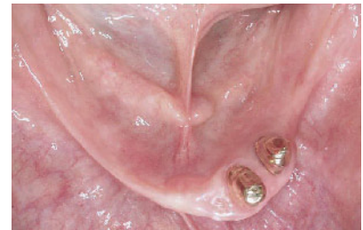
Abbildung 8b Intraorale, okklusale Ansicht der neuen Unterkieferversorgung.

Figure 7b Intraoral, occlusal view of the mandible supplied with telescopic crowns/prostheses.