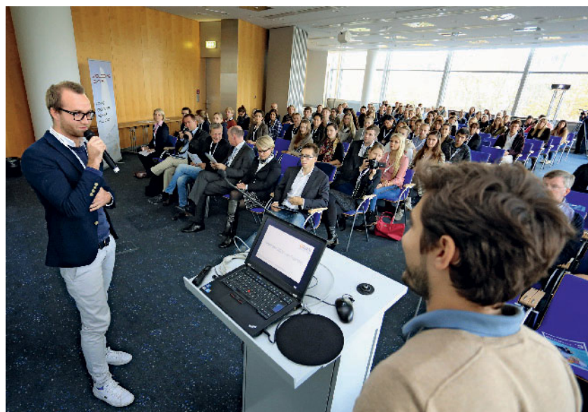
Abbildung 6 Das Programm vom Studententag war sehr gut besucht.