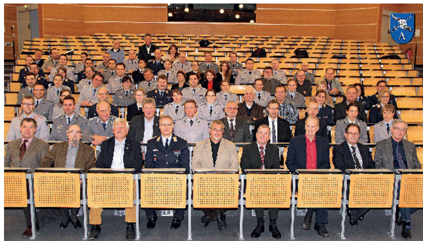
Abbildung 1 Die Teilnehmer des 15. Internationalen Symposium Forensische Odontostomatologie.