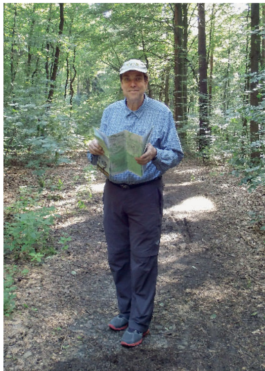
Abbildung 2 Beim Wandern lässt es sich gut abschalten und entspannen.