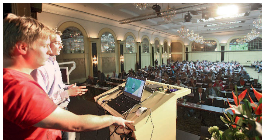
Abbildung 1 Für Forschungspreis-Bewerber ist es eine Motivation, ihre Arbeit auf dem Keramiksymposiumdem Fachpublikum vorstellen zu können. (Abb. 2: AG Keramik)

Die Arbeit ist in 4 Exemplaren in deutscher Sprache in publikationsreifer