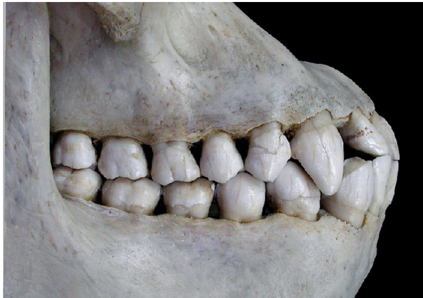
Abbildung 3 Eine Zwei-zu-eins-Verzahnung, hier exemplarisch bei einem Orang Utan abgebildet, entspricht einer natürlichen Okklusion. So hatte sich auch unser Kausystem einst über Millionen von Jahren evolutionär-funktional adaptiert.