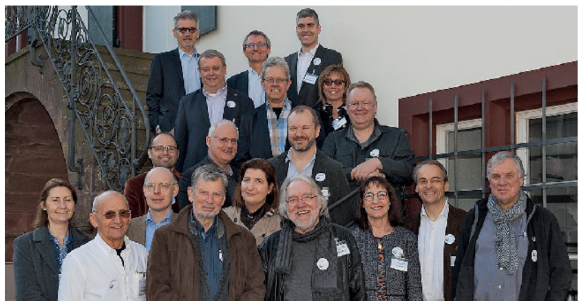
Abbildung 1 Gruppenbild der Kongressteilnehmer.

Bereits Eduard Mühlreiter ging in seiner „Anatomie des menschlichen Gebisses“ (Leipzig 1870; S. 68–69) relativ detailliert auf die Abnutzung der Zähne ein. In einer späteren Auflage (1920) unterschied er eine Kontakt-