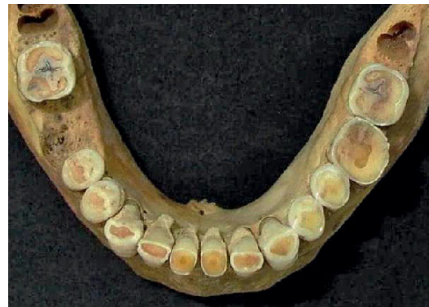
Abbildung 2 Natürliche Okklusionsverhältnisse in Ober- und Unterkiefer bei einer Bestattung aus dem Mittelalter (Hettstedt, Sachsen-Anhalt) im Erwachsenenalter. Da der gleichmäßige Abrieb alle Zähne erfasst und in diesem Fall auch keine Benutzung der Zähne als „dritte Hand“ vorliegt, ist es nirgendwo im Gebiss zu einer durch exzessiven Abrieb verursachten Pulpa aperta gekommen.

Attrition bzw. der Verlust der ursprünglichen Kompensationsmechanismen und eine Abnahme der Kaueffizienz. Kurt W. Alt gelangte zu acht Schlussfolgerungen (Tab. 2) und brachte unter Bezug auf die Perspektive der „Jakobsleiter“ Fragen und Aussagen in die Diskussion ein (Tab. 3).