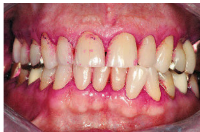
Abbildung 1d Zustand nach dem zweiten Mal Zähneputzen mit einer Handbürste und erneutes Anfärben der Plaque (QHI = 1,4 und API = 70,8 %)

Figure 1c Condition after the first brushing with a manual toothbrush and staining the plaque (QHI = 2.8 and API = 95.8 %)