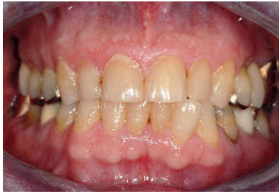
Abbildung 1a 72-jähriger Patient vor Visualisierung der Plaque

Figure 1a 72 year old patient before plaque visualization