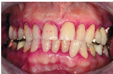
Abbildung 1c Zustand nach dem ersten Mal Zähneputzen mit einer Handzahnbürste und erneutes Anfärben der Plaque (QHI = 2,8 und API = 95,8 %)

Figure 1b Condition after staining of the plaque (QHI = 3.4; API = 100 %)