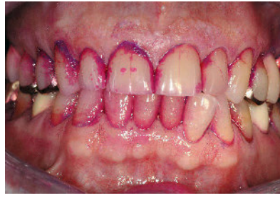
Abbildung 1b Zustand nach dem Anfärben der Plaque (QHI = 3,4; API = 100 %)

Figure 1a 72 year old patient before plaque visualization