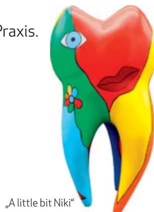
„A little bit Niki“