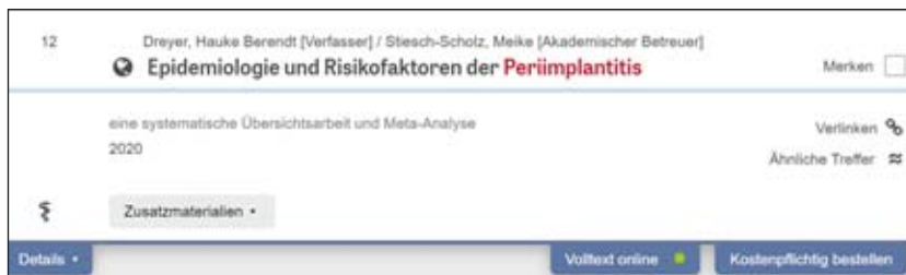
Abbildung 4 Reiter für Details und Information zur Verfügbarkeit eines kostenfreien Onlinezugangs zum Volltext