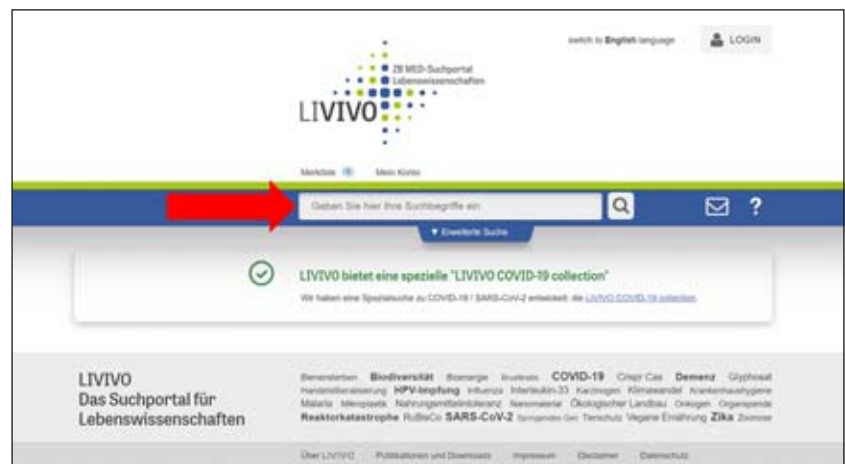
Abbildung 1 LIVIVO-Startseite, deutsche Benutzeroberfläche: Der rote Pfeil markiert das Suchfeld für eine „Einfache Suche“.

Mehrere Suchbegriffe werden – wie bei PubMed oder Google Scholar – mit den booleschen Operatoren AND, OR oder NOT verknüpft. Durch Einsatz eines